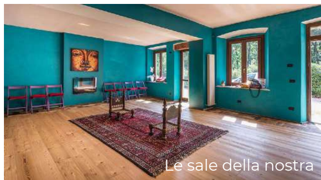
Le sale della nostra