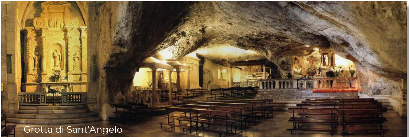
Grotta di Sant'Angelo